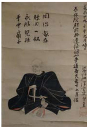
有馬豊氏像 (梅林寺蔵)