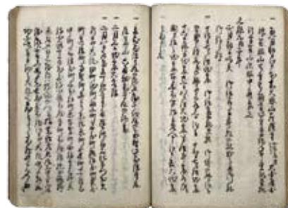
石原日記写 (元禄九年白石火事の記事)