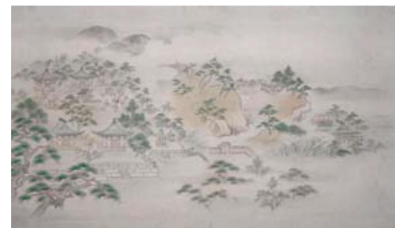
江南山図「靈廟図」(梅林寺蔵)

有馬家が治めた約250年の間に、久留米藩領内では多種多様な文化が開花しました。茶道や詩歌に優れた大名有馬家の側面や、その帰依を受けた寺社に伝わる品々を公開します。