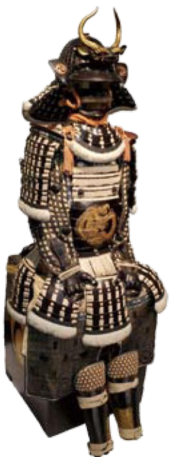
練革黒漆塗白糸威五枚胴具足 (久留米市教育委員会蔵)

久留米藩政のトップであるとともに、茶人、和算研究者、愛犬家など、バラエティに富む人材を輩出した有馬家。ゆかりの作品や歴史資料を通して、歴代藩主の功績やエピソードを紹介し、知られざる人となりに迫ります。