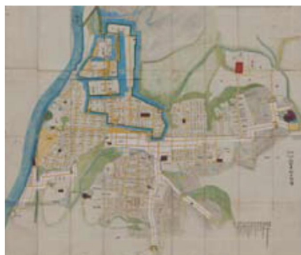
天保時代久留米城下地図 (久留米市教育委員会蔵)

現在の都市・久留米は、久留米藩主初代・有馬豊氏の入国を機に築かれた久留米城と、江戸時代を通して整備・改造された城下町を継承し発展してきました。都市・久留米の礎である久留米城とその城下町の歴史を紹介します。